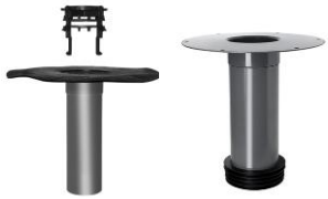
Ablauf / Sanierungsablauf

(Alle Angaben sind Richtwerte und ohne Gewähr)