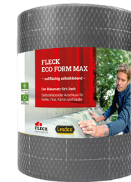
- hergestellt von Leadax -

Rückseite komplett mit Butylkleber beschichtet