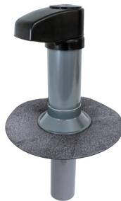
Flansch-Manschette aus Bitumen-Schweißbahn (Unterrohr abnehmbar)

für die Durchführung starrer Leitungen, z. B. von Klimaanlage oder Wärmepumpen, mit Klappenelement aus witterungsbeständigem Polypropylen (PP) und abnehmbarem Unterrohr