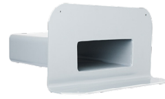
Flansch aus Polypropylen (PP), geeignet für das fachgerechte Anschweißen von TPO- und FPO-Dachbahnen