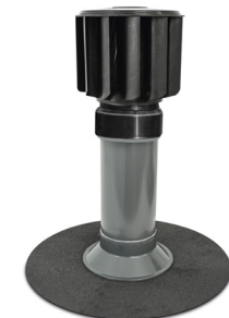
Flansch-Manschette aus Bitumen-Schweißbahn