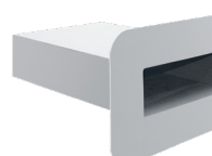
Flansch aus Polypropylen (PP), geeignet für das fachgerechte Anschweißen von TPO- und FPO-Dachbahnen