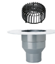
Flansch aus Polypropylen (PP), geeignet für das fachgerechte Anschweißen von TPO- und FPO-Dachbahnen