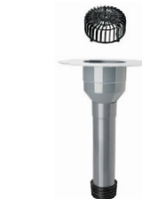
Flansch aus Polypropylen (PP), geeignet für das fachgerechte Anschweißen von TPO- und FPO-Dachbahnen