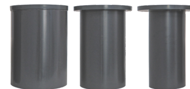
Systemrohre aus Hart-PVC