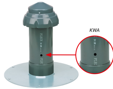
Flansch aus Polypropylen (PP), geeignet für das fachgerechte Anschweißen von TPO- und FPO-Dachbahnen