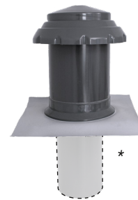
Flansch-Manschette aus Kunststoff- bzw. Elastomerdachbahn * Systemrohr (separat erhältlich)