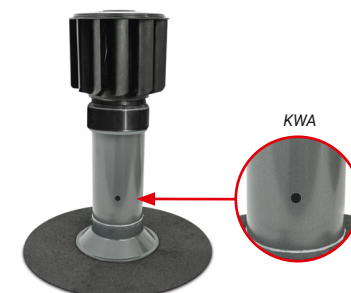
Flansch-Manschette aus Bitumen-Schweißbahn