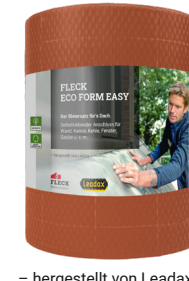
- hergestellt von Leadax -

mit zwei Selbstklebestreifen auf der Rückseite