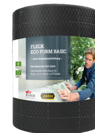
- hergestellt von Leadax -

ohne Klebemittel auf der Rückseite, Befestigung kann mithilfe unseres Kartuschenklebers Leadax HIGH-TACK erfolgen