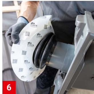
6 Unterspannbahn-Dichtmanschette über das Unterrohr führen.