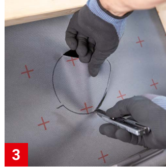
3 Unterspannbahn entlang des angezeichneten Kreises ausschneiden.