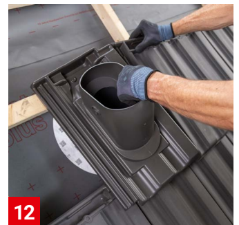
12 Dach rechts vom Lüfter wieder eindecken und Lüfterpfanne positionieren.