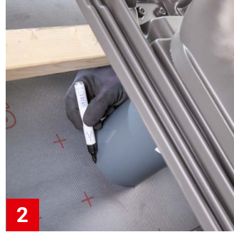
2 Anschlussstutzen der Lüfterpfanne auf die Unterspannbahn setzen und finale Position anzeichnen.