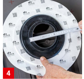
4 Prüfen, ob die Unterspannbahn-Dichtmanschette 1 und der Durchmesser des Anschlussstutzens zueinander passen.