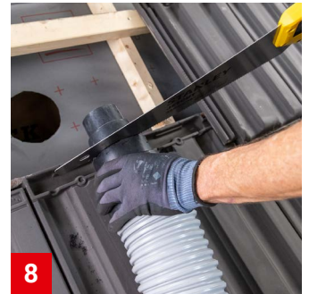
8 Falls nötig: Reduzierstück mit einer Säge an den Durchmesser der Anschlussleitung anpassen.