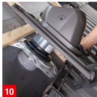
10 Universalschlauch durch die Unterspannbahn sowie ggf. die Dämmung führen. Die Schlauchführung muss mit Gefälle verlaufen.