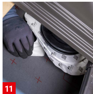
11 Unterspannbahn mit Unterspannbahn-Dichtmanschette verkleben, indem die rückseitige Schutzfolie entfernt wird 3 .