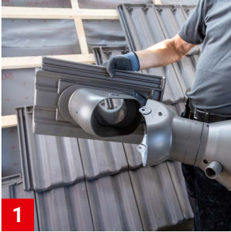
1 Lüfteroberteil des Aura-Lüfters entfernen.