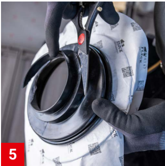
5 Falls nötig: Größenanpassungen vornehmen, indem die Unterspannbahn-Dichtmanschette der Kontur folgend abgeschnitten wird.