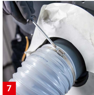
7 Flexiblen Universalschlauch 1 mit einer Schlauchschelle am Anschlussstutzen befestigen.