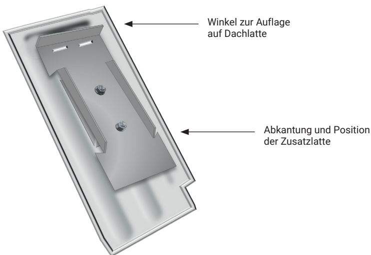
Abb. 2: Schematische Darstellung der Unterseite