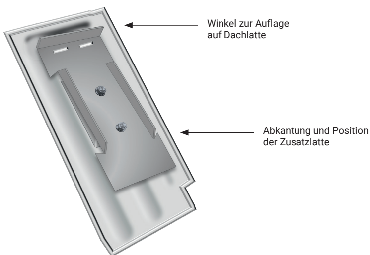
Abb. 2: Schematische Darstellung der Unterseite

* handelsübliches Zubehör, das nicht bei FLECK erhältlich ist