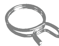
Federdrahtschelle * (exemplarische Abb.)

* handelsübliches Zubehör, das nicht bei FLECK erhältlich ist