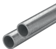
Rohre (Ø 30 – 40 mm) * (exemplarische Abb.)