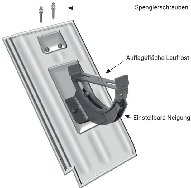
Abb. 1: Schematische Darstellung der Vorderseite